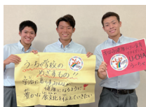
立命館宇治高等学校のみなさん